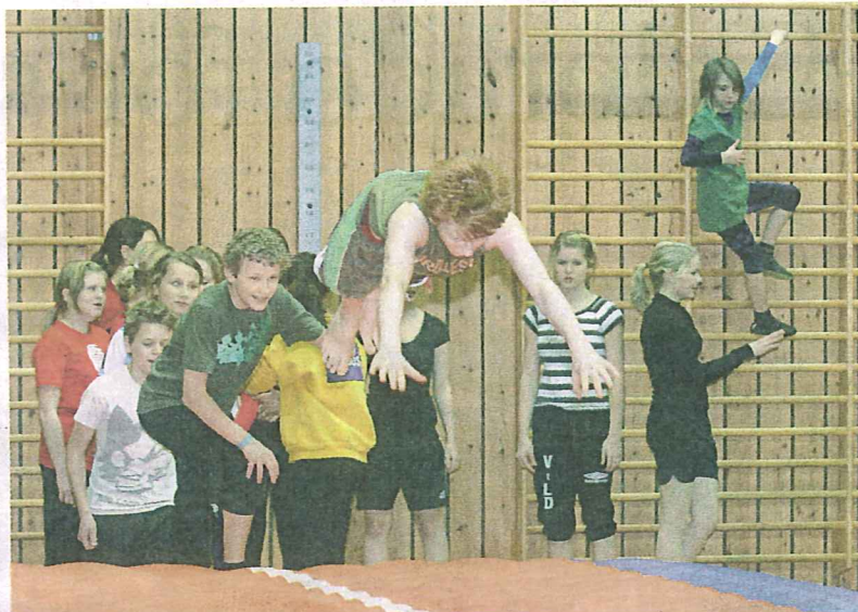
Turn- og trampettgruppa i Eid IL er ein av dei største brukarane av idrettshallen.