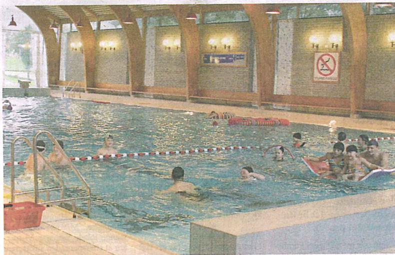
Mange familiar nyttar seg av tilbodet om offentleg bading i symjehallen.